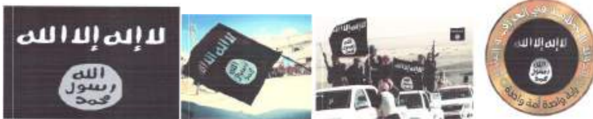
Рисунок 12. Символика организации «Исламское государство».