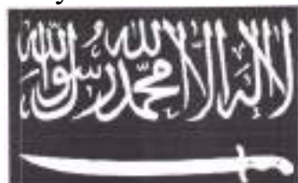
Рисунок 13. Символика организации «Кавказский эмират» («Имарат Кавказ»).