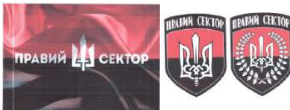
Рисунок 11. Атрибутика организации «Правый сектор».