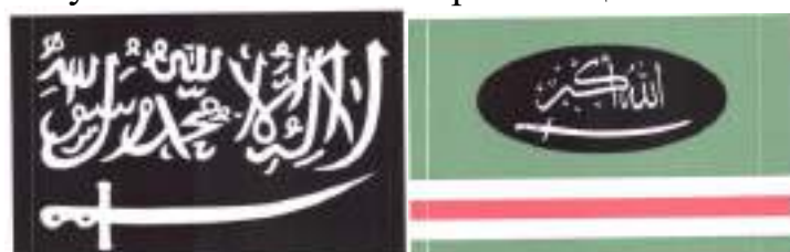
Рисунок 14. Символика вилайетов (административно-территориальных образований) организации «Кавказский эмират» («Имарат Кавказ»).

Отсутствие осознания общественной опасности террористических проявлений подростком может выражаться в наличии в публикациях на его странице или странице его друзей, а также страницах сообществ (групп), в которых он состоит (на которые подписан), информационных материалов, оправдывающих совершение преступлений экстремистской и террористической направленности, в том числе на территории зданий органов государственной власти и местного самоуправления.